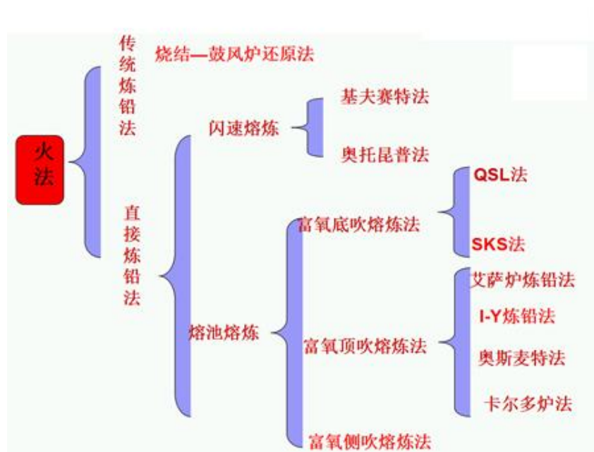
图 1-2 火法炼铅工艺