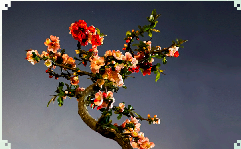
海棠盆景 部机关退休干部 崔宝庆