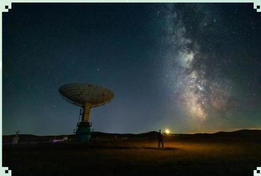
昨夜星辰 部机关退休干部 刘金荣