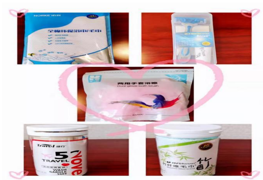
图7 环保洗漱用品（付费）

2. 宾馆房间取消“六小件”。一方面，打消宾客对房间“六小件”免费用品不用白不用的心里；另一方面，如果是付费购买，就不会使用一次随手扔掉，还会逐渐养成随身携带洗漱用品的习惯，唤醒消费者的环保意识。