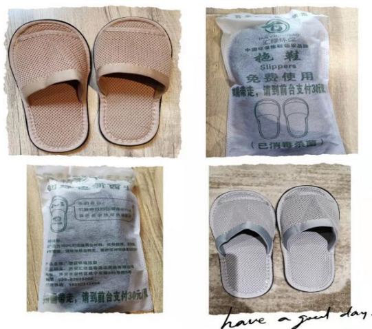
图 6 环保拖鞋

1. 将现有的一次性拖鞋更换为可消毒再使用的环保拖鞋。可重复使用，洗涤、消毒、烘干、包装、配送一站式服务，不担心积压，减少库存，节约能源，也降低成本。在包装袋子上注明“免费使用。睡完走，请到前台支付3元/双”。