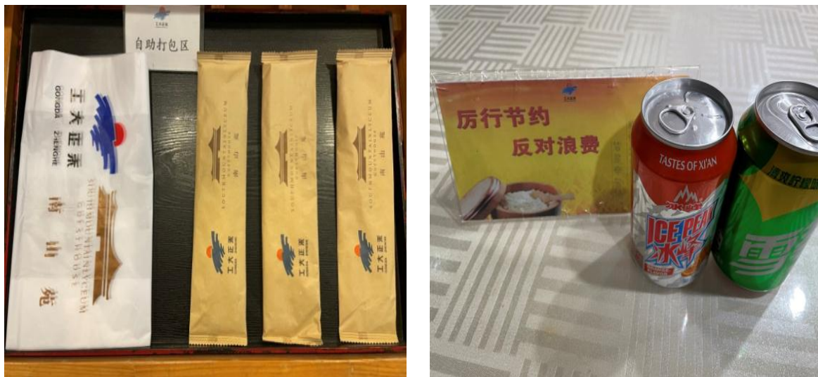
图 5 自助打包台