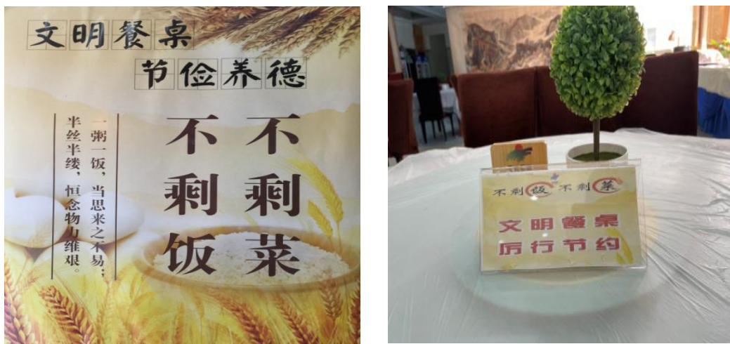
图 2 反对浪费标识