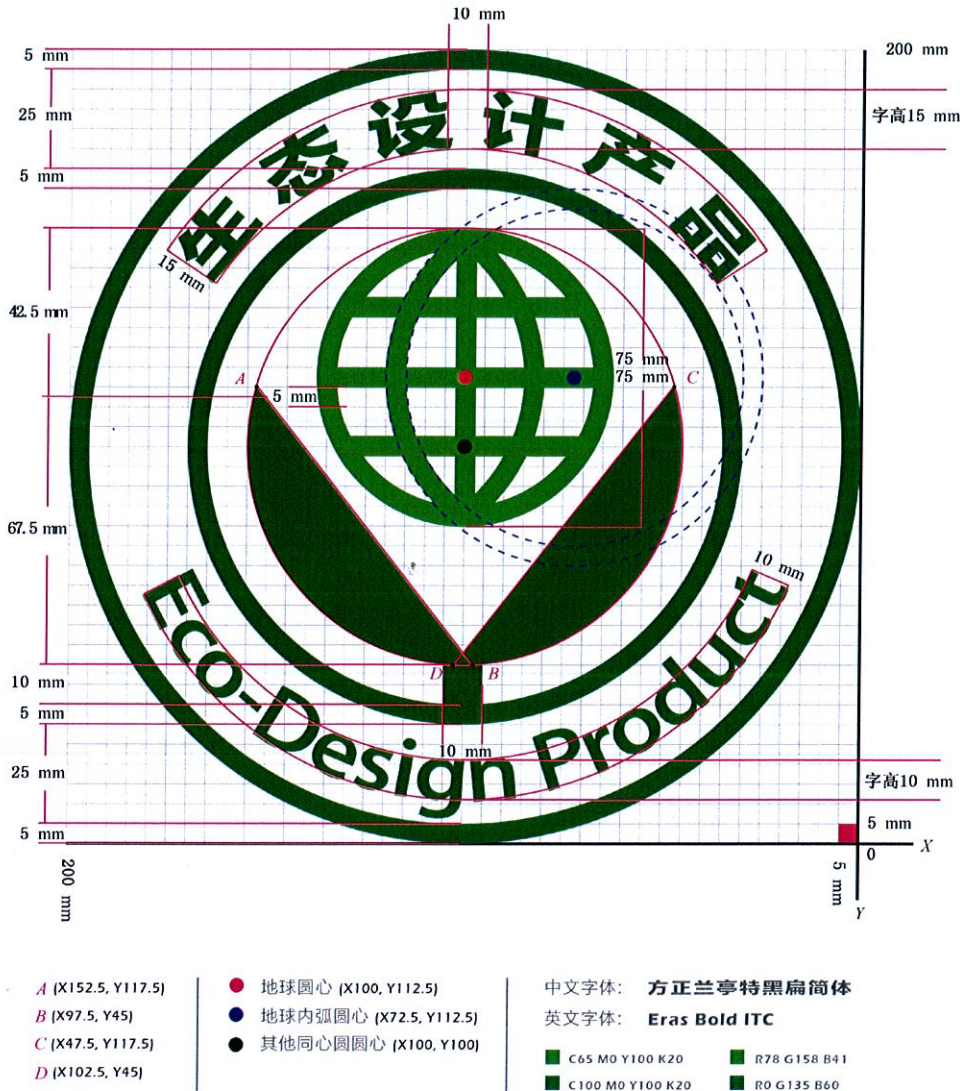
图 A.1 生态设计产品标识图样及尺寸

生态设计产品标识图样及尺寸见图 A.1,其中 A、B、C、D 为同一个圆上的四个点,用以确定绿色叶片的位置和大小,红色、蓝色和黑色的三个点为三个同心圆的圆心。上述各点的坐标、中英文字体和颜色如图 A.1 所示。