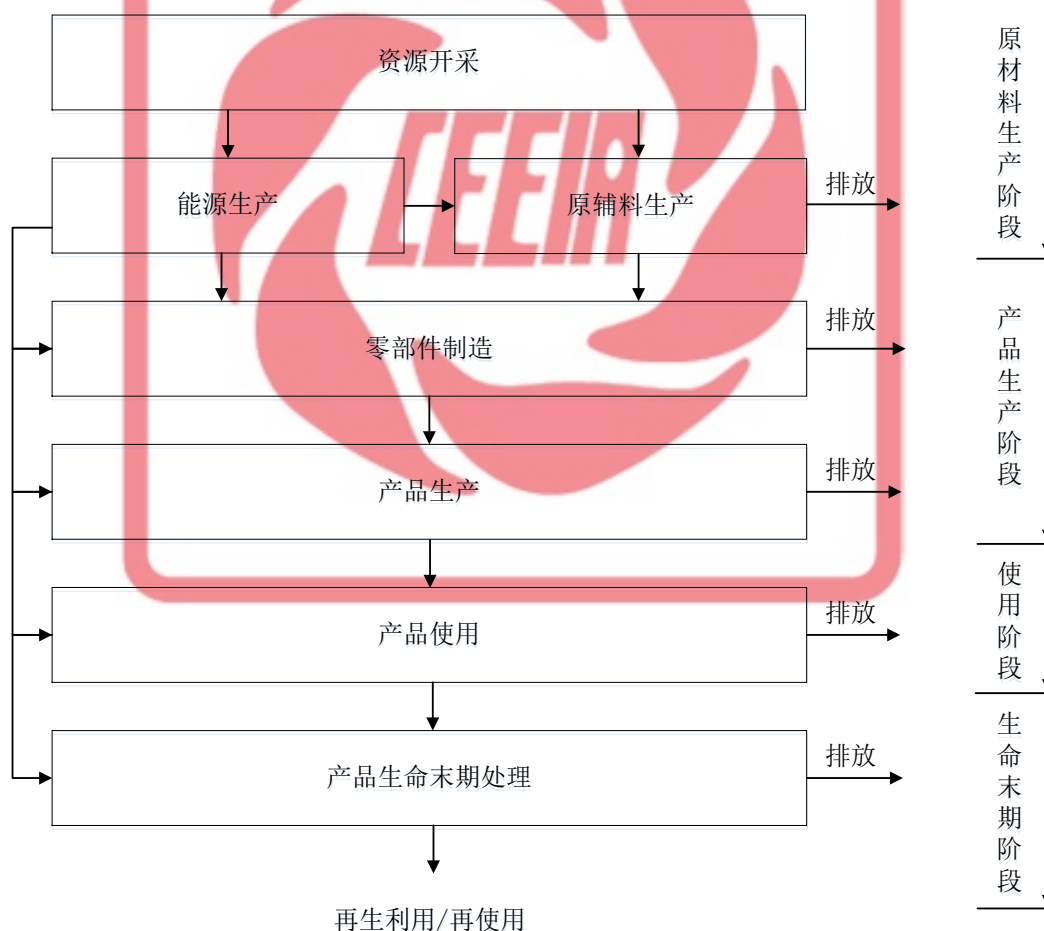
图A.2 电子电气产品生命周期示意图

电子电气产品生命周期包括从资源开采开始的原材料和能源生产、零部件和原辅料生产、产品生产、产品使用、产品生命末期处理以及运输过程（如图A.2所示）。